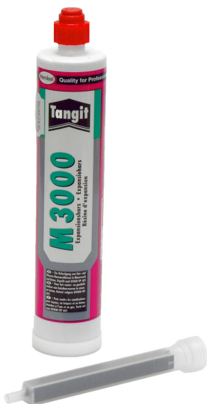
Résine bicomposant M3000