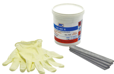
kit de montaje