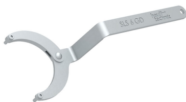
Llave de gancho articulada