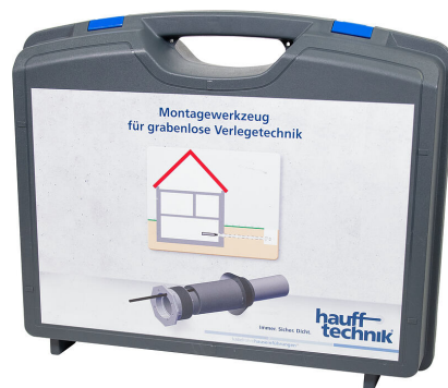
Maletín de montaje MIS NoDig