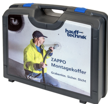
Maletín de montaje ZAPPO