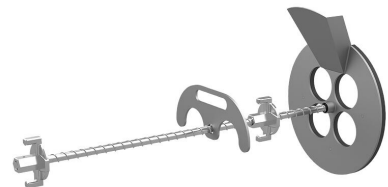
Dispositivo de relleno