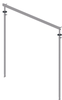
Dispositivo de ajuste