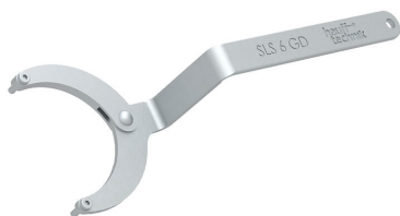
Llave de gancho articulada