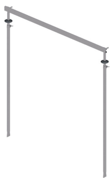
Dispositivo de ajuste