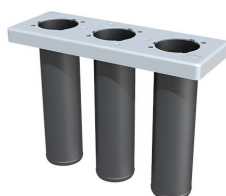
Inserto de sellado para el componente