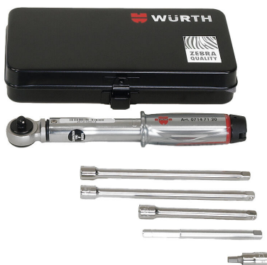
Werkzeugset für HSI150 DG/HRK SSG