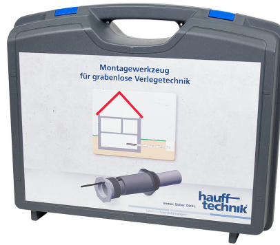
Montagekoffer MIS NoDig