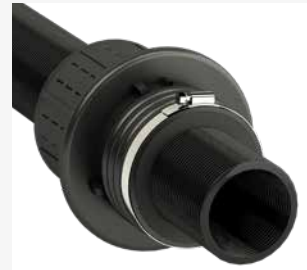
➔ für Kabelschutzrohre DN 75-DN 160