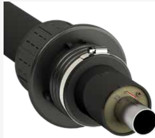
➔ für KMR-Fernwärmerohre DN 75-DN 160