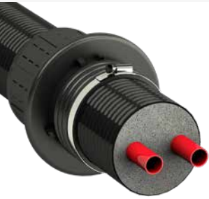
➔ für Nah-/Fernwärmerohre DN 75-DN 160