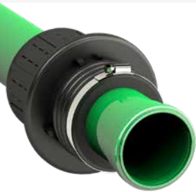
➔ für KG/KG2000-Rohre DN 110-DN 160