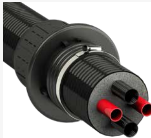
➔ für Wärmepumpenrohre DN 125-DN 160