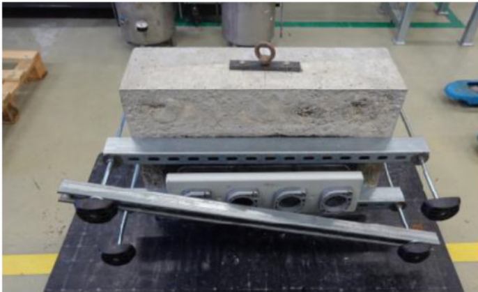
Abbildung 2. Versuchsaufbau – Unterseite.