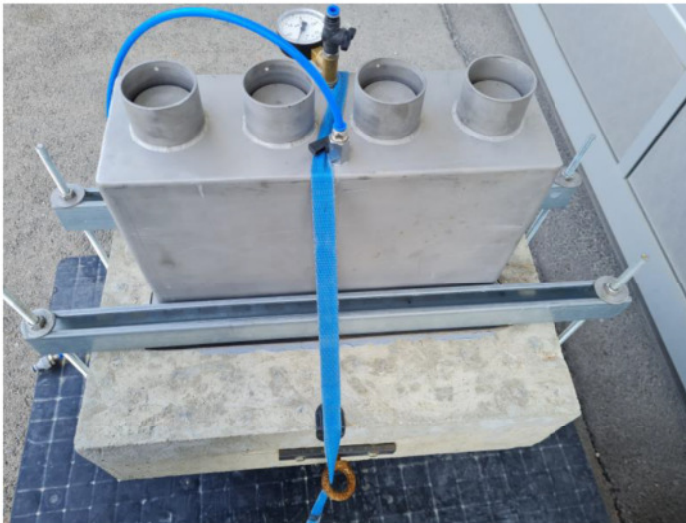
Abbildung 1. Versuchsaufbau - Gesamtsystem

Hierfür wurden von der Hauff-Technik GmbH ein fertig montierter Versuchsaufbau mit einbetonierter Mehrspartenhauseinführung in unser Labor in Gersthofen angeliefert (vgl. Abbildung 1 und Abbildung 2).