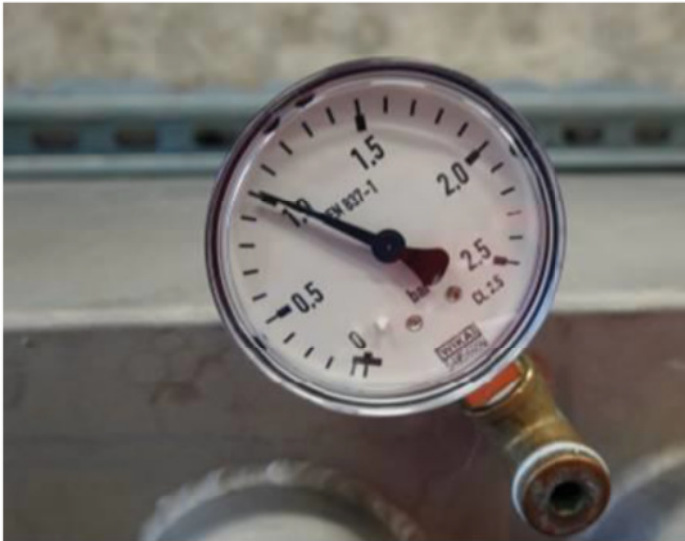
Abbildung 4. Wasserdruck \geq 1,0 bar.