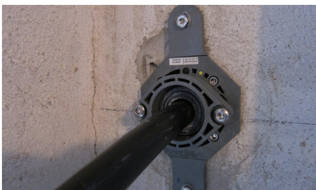
Fertig montierte und ausgehärtete Hauseinführung mit mechanischer Fixierung und Abdichtelement für Strom. Geeignet für Medienleitungen Wasser oder Strom bis DA 50. Dichtelemente baugleich zu Hauff-Mehrsparteneinführung.