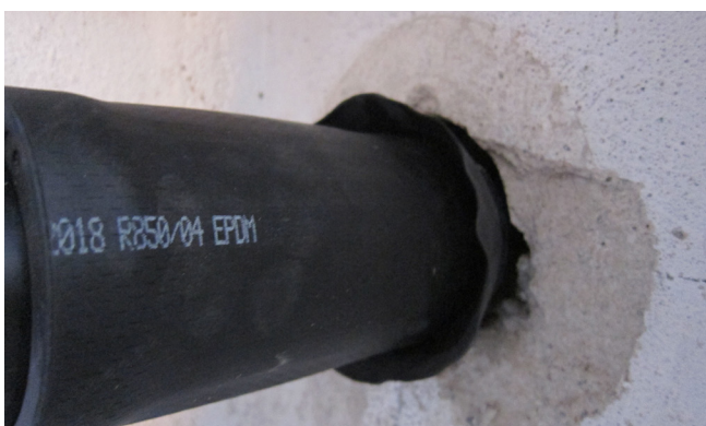
Nach dem Erstellen einer Leerrohrtrasse (DA 63) mittels einer Erdverdrängungsrakete wird die Hauseinführung über das Vortriebsrohr und anschließend in die Kernbohrung eingeschoben.