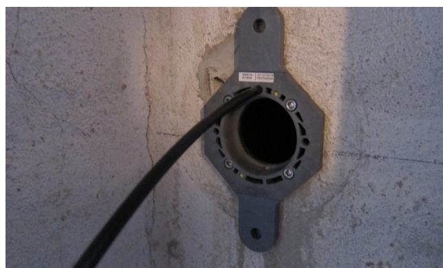
Komplett eingeschobene Einzelhauseinführung für grabenlose Bauweise mit Befestigungslaschen (mechanische Fixierung bei schlechtem Mauerwerk) vor dem Aushärten.