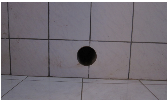
Sanierung von Hausanschlüssen im Bestand. Erschwerte Bedingungen durch unterschiedliche Kellerbauweisen und Baustoffe. Erstellung einer Kernbohrung 99-103 mm.