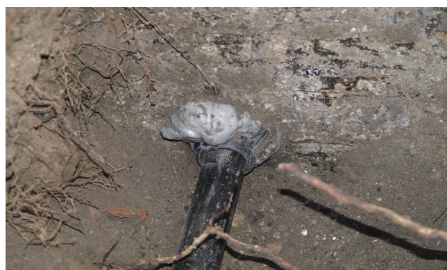
Kontrollöffnung an der Gebäudeaußenseite: Das unter dem Schirm komplett aus- / u. teilweise übergetretene Harz ermöglicht das Einbinden einer eventuell vorhandenen Flächenabdichtung.