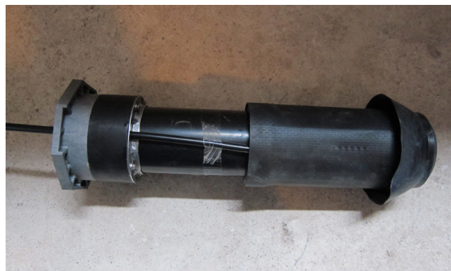
Anpassen der Hauseinführung auf die örtlichen Gegebenheiten: Einkürzen und Anpassen auf Wandstärke. Die Abdichtung erfolgt mittels Einbringung eines 2-Komponenten-Harzes über einen Verfüllschlauch.