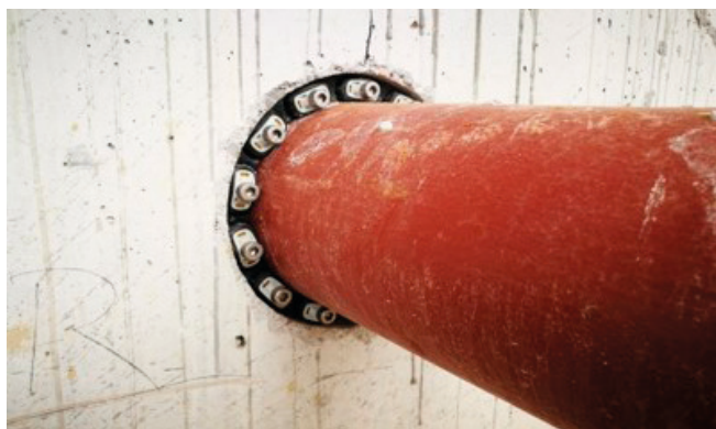
Vgrajeno tesnilo GKD 300 (izvrtina fi 200 mm in cevjo fi 160 mm)