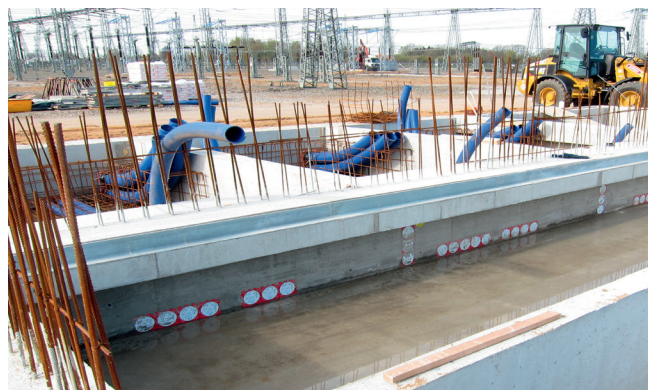
Posa dei sistemi passacavi flessibili KES-M 150 con Hateflex 14150 e KES-M 90 con Hateflex 14090.