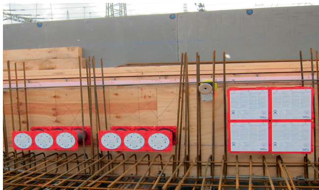
I passaggi impermeabili HSI 90 e HSI 150 e gli ingressi per la messa a terra sono stati incorporati nella cassaforma.