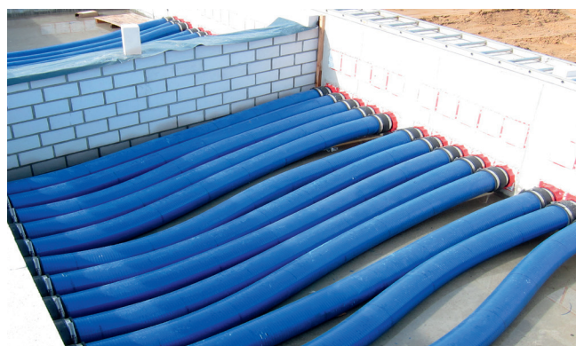
I sistemi KES 14090 sono stati collegati ai passaggi impermeabili sigillati nel calcestruzzo HSI 90 tramite la tecnica del manicotto.