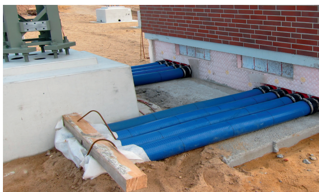
I sistemi KES 14150 sono stati collegati ai passaggi impermeabili sigillati nel calcestruzzo HSI 150 tramite la tecnica del manicotto.