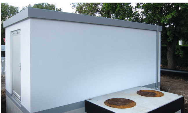
Die Anschlüsse an das Technikgebäude erfolgen über zwei Kabelzugschächte.