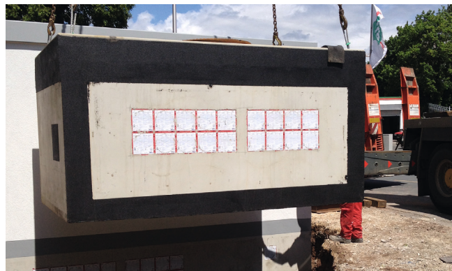
Setzen eines Kabelzugschachtes mit Autokran