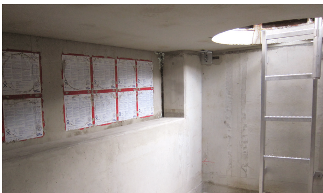
In den Kabelzugschächten sind Aussparungen für die Kabeldurchführungen vorgesehen.