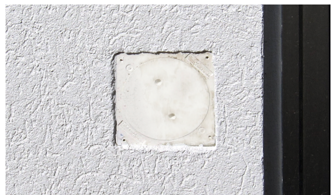
Durch die Baustromdurchführung BD 90 können Kabel elektrischer Geräte verlegt werden, die außerhalb des Technikgebäudes betrieben werden, wobei die Tür des Technikgebäudes geschlossen bleiben kann.