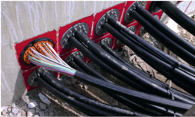
Die Abdichtung der Mikroröhre erfolgt mit SEGMENTO (oben links) sowie der Kabel und Leerrohre mit der Ringraumdichtung HRD 150/160.