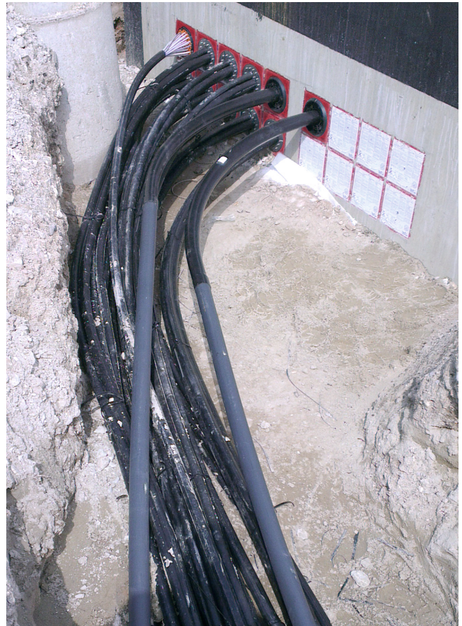
Anschluss von Leerrohren, Kabeln und Mikroröhren an den Kabelzugschacht.