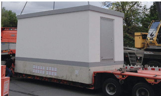
Anlieferung des Technikgebäudes