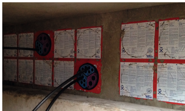
Kabelabdichtung mit SEGMENTO vom Kabelzugschacht zum Technikgebäude.