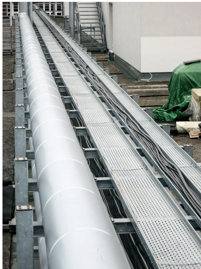
Dachtraverse Haus 3 Ebene 6

Das traditionsreiche und größte Bremer Krankenhaus wurde bereits 1851 an der Sankt-Jürgen-Straße gegründet. Das denkmalgeschützte Haus 2 wird durch ein neues Eltern-Kind-Zentrum erweitert, welches sich nahtlos in den weitläufigen Klinikbestand einfügen soll. Seit Baubeginn Anfang 2013 war die Firma Hauff-Technik bereits in die Planung aktiv eingebunden. Die Herausforderung war, eine fachgerechte und wasserdichte Abdichtung der Dachtraversen im Haus 3 zu gewährleisten.