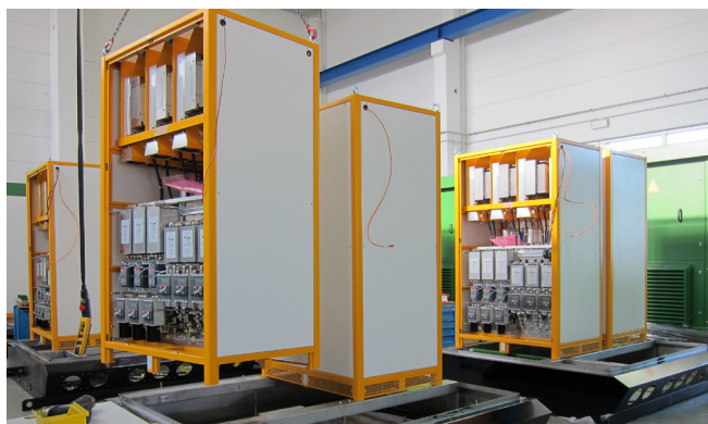
Montaje de los módulos individuales.