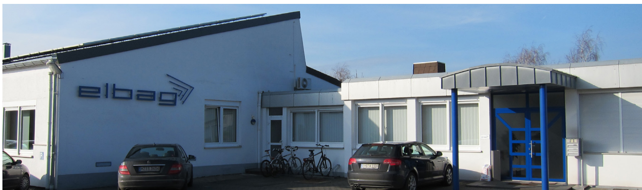
Sede de la empresa elbag en Weisel

La empresa elbag Energietechnik GmbH siempre ofrece a sus clientes soluciones personalizadas. Proveedores como Hauff-Technik GmbH & Co. KG también están a la altura de esta exigencia de orientación absoluta al cliente. En combinación con la alta calidad del producto, esta es una razón decisiva por la que elbag valora tanto la exitosa colaboración con Hauff-Technik. Entre nuestros clientes se encuentran empresas industriales, empresas de suministro de energía, constructores de plantas tanto nacionales e internacionales, así como instituciones públicas. El foco de ambas empresas está siempre en satisfacer las necesidades individuales que dan al cliente una ventaja decisiva en términos de precio y tecnología.