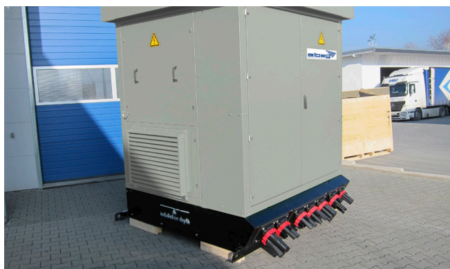
Puesta en marcha de las estaciones de inversores listas para la carga con bridas de aluminio premontadas y tapas de sistema.