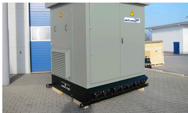
Estación del inversor con bridas de aluminio premontadas HSI 150-DF y HSI 90-DF.

Las bridas de estanqueidad HSI 150-DF pueden equiparse con tapas de sistema o insertos de sistema a través del sistema de bayoneta, según la asignación de cables. Los pasacables se colocan según las necesidades del cliente. Gracias a la instalación inclinada de la superficie de sellado en la carcasa de la estación, los cables también se pueden tender de forma óptima respetando los radios de curvatura mínimos.