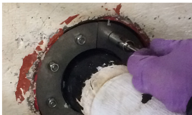
Montaža HRD 188-1G-1/97