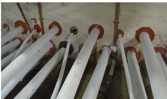
Kabelski uvod s testno montažo 2 tesnil