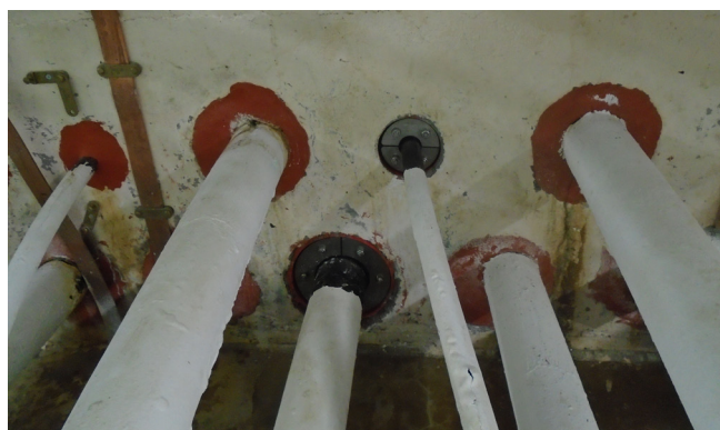
Testna montaža 2 tesnil