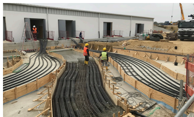
Gettata di calcestruzzo del giunto per tubi di protezione tra l'edificio nuovo e gli edifici esistenti.

L'impresa Knoll GmbH & Co. La KG, a nome del gestore dell'impianto di trasmissione bayernets GmbH, è coinvolta nei lavori di edilizia del soprasuolo e di edilizia sotterranea per la costruzione di una nuova stazione di compressione del gas naturale in Baviera (Wertingen/Schwaben).