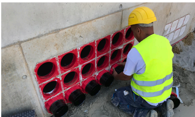
Montaggio delle coperture dell'impianto HSI 150 – M168 WR per il collegamento successivo di tubi di protezione per cavi ondulati.