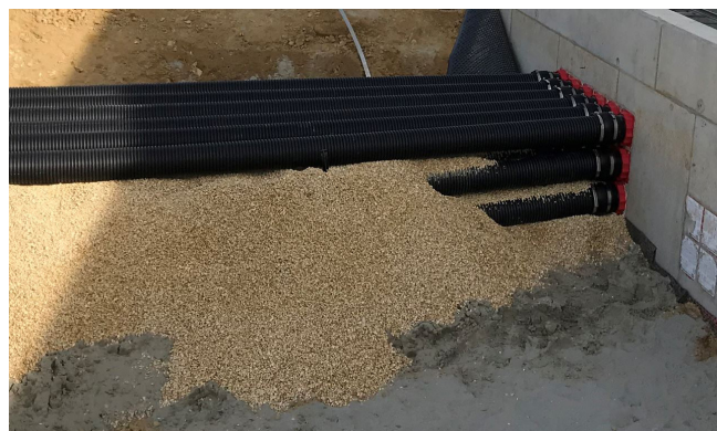
Tubi di protezione premontati su passaggi impermeabili HSI 150.